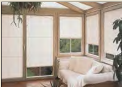
Sonnenschutz im Sommer

Gardinen | Bodenbeläge | Parkettböden Sonnenschutz | Kurzwaren